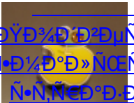
ДŸД³/⁴Д'Д²ДµÑ·Д°Д,Ñ· Д·Д¹/⁴Д»Ñ€Ñž,Ñ·Д³/⁴ Ñ·Ñ,Ñ€Д°Д,Д°Д¹/⁴Д, (142)