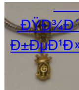
ДŸД³/⁴Д'Д²ДµÑ·Д°Д,Ñ· Д±ДµД¹Д»Д°Д¹/⁴Д, (15)