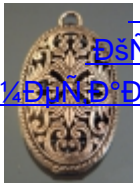
ДšÑfД» Д¹/⁴ДµÑ·Д°Д»Д»Д» (15)