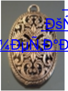
ДšÑfД» Д¹/⁴ДµÑ·Д°Д»Д»Д» (15)