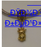
ДŸД³/⁴Д'Д²ДµÑ·Д°Д,Ñ· Д±ДµД¹Д»Д°Д¹/⁴Д, (15)