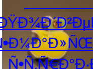
ДŸД³/⁴Д'Д²ДµÑ·Д°Д,Ñ· Д¹/⁴Д°Д»Ñ€Ñž,Ñ·Д³/⁴ Ñ·Ñ·Ñ€Д°Д,Д°Д¹/⁴Д, (142)