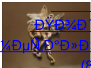
ДŸД³/⁴Д'Д²ДµÑ·Д°Д, Д¹/⁴ДµÑ·Д»Д,Ñ±ДµÑ·Д°Д,Дµ (86)