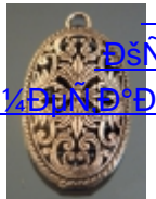
ДšÑfД» Д¹/⁴ДµÑ·Д°Д»Д»Д» (15)