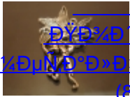
ДŸД³/⁴Д'Д²ДµÑ·Д°Д, Д¹/⁴ДµÑ·Д°Д»Д,Ñ±ДµÑ·Д°Д,Дµ (86)