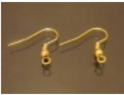
Фурнитура для изготовления бижутерии #00104 Цена за парочку ±3,00

[Фурнитура для изготовления бижутерии...]