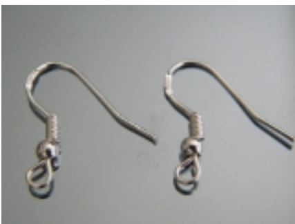
Фурнитура для изготовления бижутерии Sterling [silver] Цена за парочку ±925 #02898 Цена за парочку ±35,00

[Фурнитура для изготовления бижутерии...]