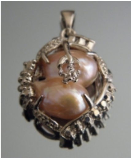
Фурнитура для изготовления бижутерии WWW.FURNITURA4BIZHU.RU