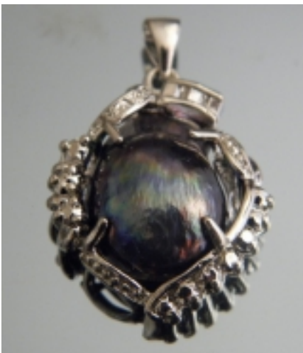
Фурнитура для изготовления бижутерии WWW.FURNITURA4BIZHU.RU