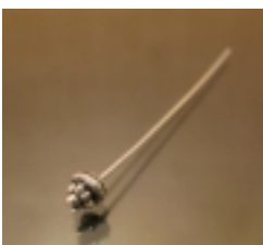
Фурнитура для изготовления бижутерии WWW.FURNITURA4BIZHU.RU