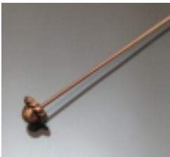
Фурнитура для изготовления бижутерии WWW.FURNITURA4BIZHU.RU