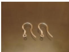
Ɔ°Ɔ²ƆµƆ½Ɔ·Ɔ̃Ɔ̃ Sterling [silver] Ɔ̃, Ɔ̃€Ɔ¾Ɔ±Ɔ° 925 #00203 Ɔ̃€Ɔ̃fƆ̃±.25,00