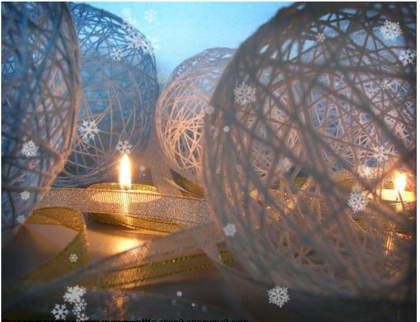
Спасибо за внимание! Не такой красивый шар